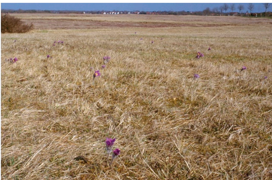
Der letzte noch existente Wuchsort der Finger-Kuhschelle in Deutschland. Das Naturschutzgebiet „Garchinger Heide“ bei München, das Anklänge an asiatische Steppen zeigt.

Das Naturschutzgebiet „Garchinger Heide“ nördlich von München ist der letzte noch existierende Fundort der Finger-Kuhschelle in Deutschland. An allen anderen Wuchsorten ist die Art spätestens kurz nach 1970 ausgestorben (BENKERT 1978). Bei dem noch 1950 nachgewiesenen Vorkommen an der Donau handelte es sich um Individuen aus einer nicht nachhaltig erfolgreichen Rettungs-Umpflanzung eines Wuchsortes (SCHÖNFELDER & BRESINSKY 1990). Daher wird sie in den Roten Listen von