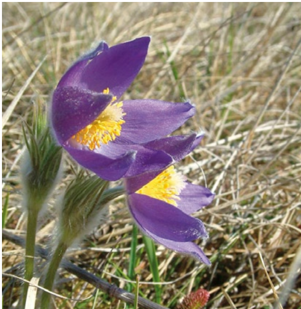
Starke Behaarung schützt die früh im Jahr blühende Finger-Kuhschelle vor Frost und kalten Winden (Foto: Daniela Röder).

Familie: Hahnenfußgewächse (Ranunculaceae)