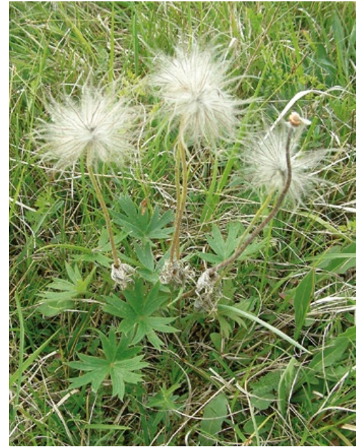
Samenstände und Grundrosette der handförmigen Blätter von Pulsatilla patens.

Da weniger als 10 % des besiedelten Arealen in Deutschland liegen (isolierter Vorposten), hat Deutschland nur eine mittlere Verantwortung